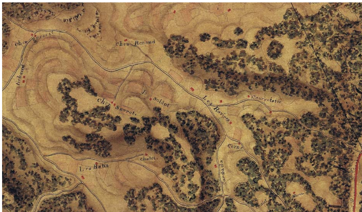
Carte IGN de 1785

La carte ci-dessus montre à l'évidence que chez Greset se trouve à l'entrée d'un vallon d'importance où l'on trouvera toutes sortes de domaines et de fermes que nous allons décrire dans les prochains chapitres.